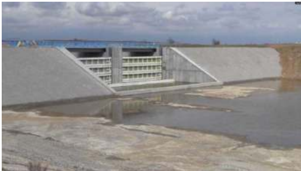
Дамба, перекрывавшая Северо-Крымский канал