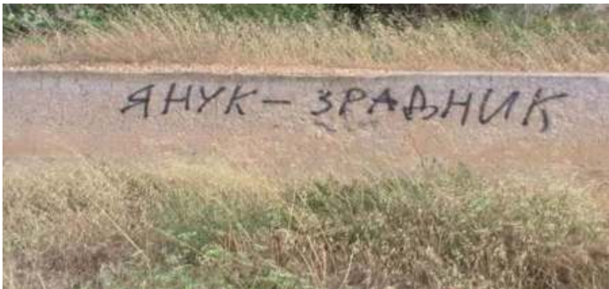
Примеры провокационных граффити националистического и антироссийского содержания. Севастополь, 26 июня 2010 года

В конце 2009 года и в начале 2010 года севастопольцы дали решительный отпор украинским националистам из партии «Всеукраинское объединение «Свобода» (организация запрещена в России), которые намеревались провести в регионе публичные акции (шествия, политическую агитацию).