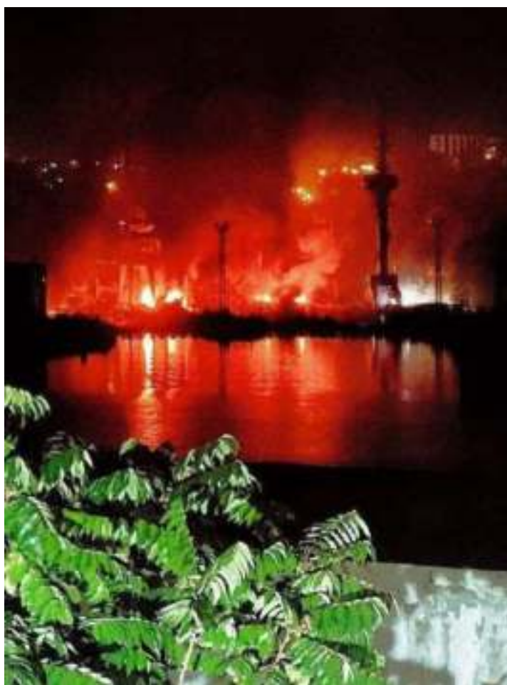
Севастопольский морской завод имени Серго Орджоникидзе после попадания ракеты Storm Shadow. 13 сентября 2023 года