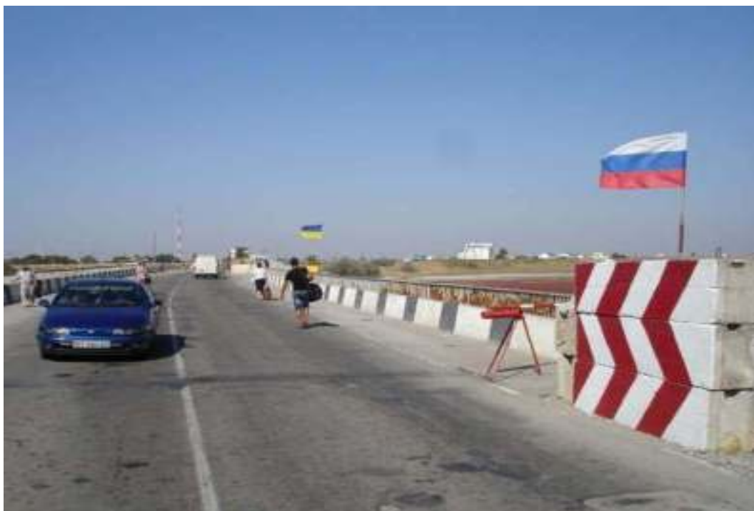
Пересечение российско-украинской границы

Совершение рейсов в Крым с территории Украины и наоборот с помощью личного автотранспорта также нередко сопровождалось очевидными сложностями. До начала спецоперации и ликвидации украинских пограничных постов распространенной практикой официального Киева стало временное прекращение работы пунктов пропуска, в результате люди на протяжении многих часов простаивали в пробках. При этом украинская сторона часто не объясняла причины подобных задержек.