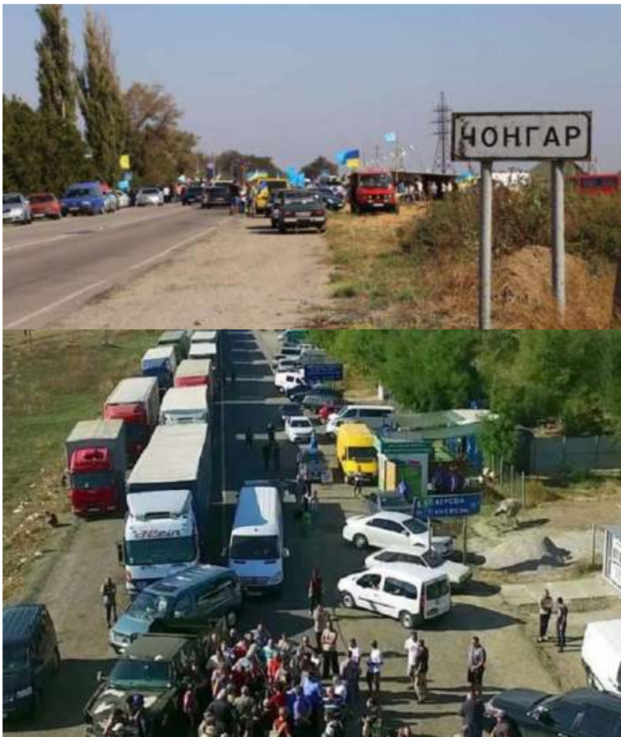
«Гражданская блокада» Крыма. Осень 2015 г.

Накануне, 8 сентября 2015 года, в ходе специально собранной пресс-конференции организаторы гражданской блокады Мустафа Джемилев и Рефат Чубаров объявили, что намерены бороться с «двойными стандартами» в российско-украинских отношениях. Экстремистов возмутило, что Украина