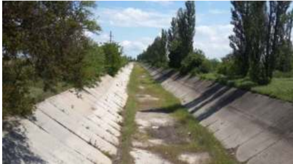
Последствия водной блокады Крыма

Водная блокада Крыма стала причиной экологической катастрофы в городе Армянске, расположенном на севере полуострова.