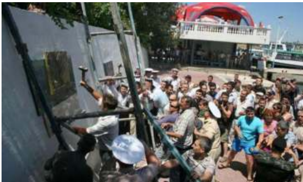
Севастополь, Графская пристань, 5 июля 2008 года