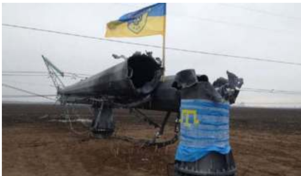
Взорванная опора линий электропередач, подающих энергию в Крым. Херсонская область (Украина), осень 2015 г.

На протяжении месяцев в обоих субъектах люди жили в режиме чрезвычайной ситуации (далее – ЧС). Проблема успешно разрешилась после строительства энергомоста.