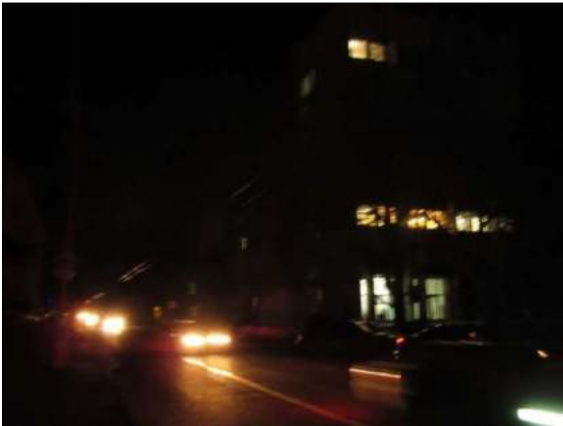
Севастополь в период энергоблокады. Декабрь 2015 г.

Начало энергоблокады совпало с началом деятельности института Уполномоченного по правам человека в городе Севастополе (далее – Уполномоченный, УПЧ или омбудсмен). В течение всего периода ситуация находилась в сфере пристального внимания омбудсмена. Критерием готовности города к режиму ЧС являлось то