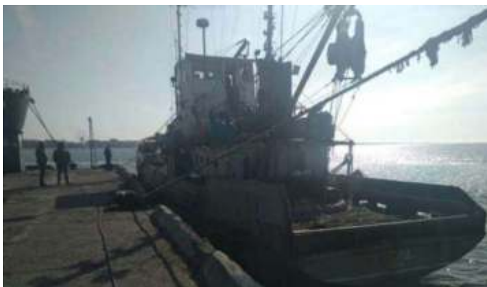
Российское судно «Норд», задержанное украинскими пограничниками

25 марта 2018 года судно с 10 членами экипажа было задержано в Азовском море.