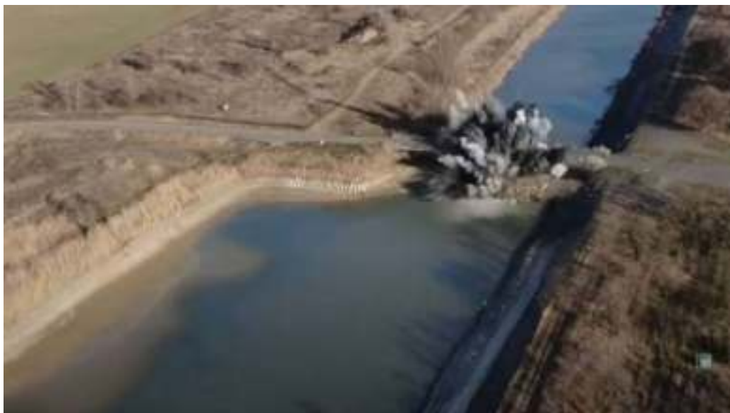
Уничтожение российскими военными дамбы, перекрывающей Северо-Крымский канал. 26 февраля 2022 года