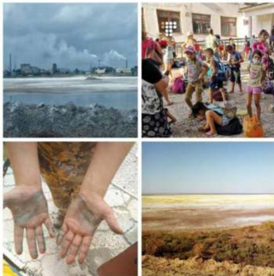
Экологическая катастрофа в Армянске и ее последствия

Временно были закрыты школы и детские сады, а дети были эвакуированы из города в санатории на Южном берегу Крыма.