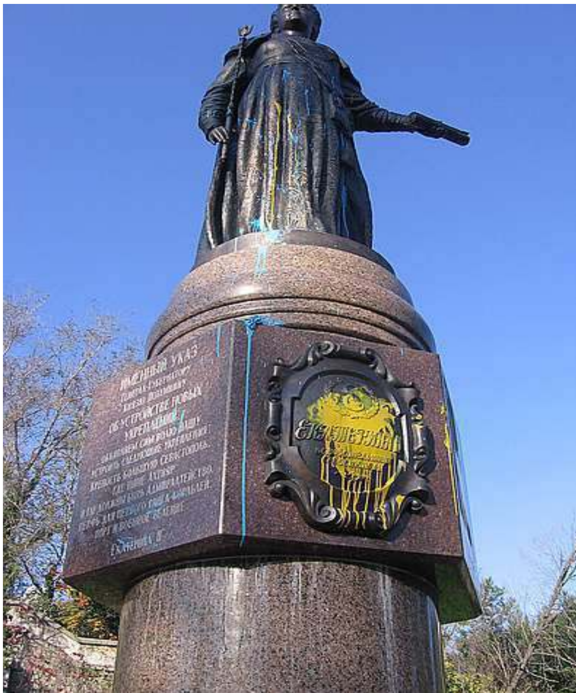
Памятник императрице Екатерине II, оскверненный украинскими радикалами. Севастополь, 28 октября 2008 года

В ночь с 27 на 28 октября 2008 года памятник облили желтой и голубой краской. Вандалы также перевернули и разбросали венки и цветы, лежавшие у подножия монумента. Прибывшие на место правоохранители зафиксировали акт вандализма.