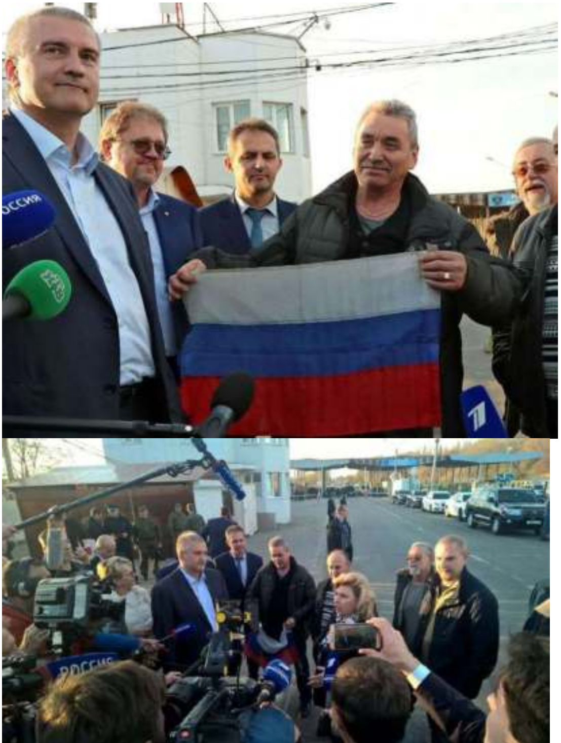
Встреча моряков судна «Норд», которые вернулись на Родину

Вне всяких сомнений, в период, предшествующий началу СВО, состоявшийся обмен являлся важным положительным событием в истории взаимоотношений России и Украины.