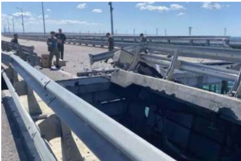
Последствия атаки ВСУ по Крымском мосту. 17 июля 2023 года

Таким образом, террористические атаки со стороны Украины не только причинили ущерб значимым объектам гражданской и военной инфраструктуры, расположенным на территории Крымского полуострова, но и привели к человеческим жертвам. В том числе среди мирных жителей.