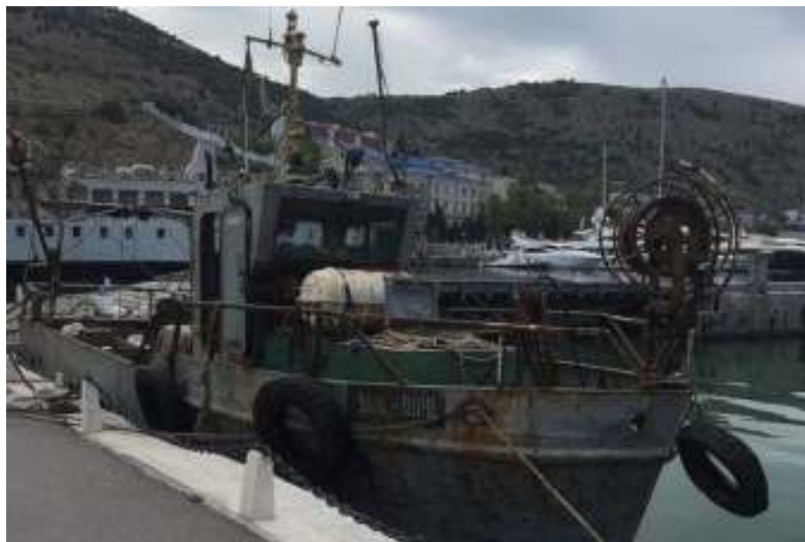
Украинское рыболовецкое судно «ЯМК-0041», задержанное у берегов Крыма

Ситуация, которая сложилась в связи с задержанием российских и украинских моряков, в течение многих месяцев находилась на личном контроле УПЧ РФ, Уполномоченных в Республике Крым и городе Севастополе.