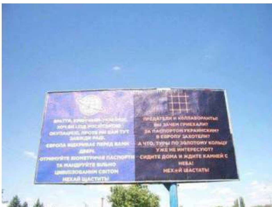
Пример агитации, направленной против жителей российского Крыма. Херсонская область (Украина), весна 2017 г.

В мае 2017 года в Херсонской области появились билборды, на которых жителям города Севастополя и Республики Крым, сделавшим выбор в пользу России, дан совет не въезжать на территорию Украины, а «сидеть дома». Щиты разделены на две части. На одной из них приветствовались украинские жители Крыма, на другой — «коллаборанты». Первым желали удачи, а вторым советовали заказывать туры по Золотому кольцу России или же оставаться дома и «ждать камней с неба». Надпись на билборде гласила, что крымчанам не надо «шастать» по территории Украины.