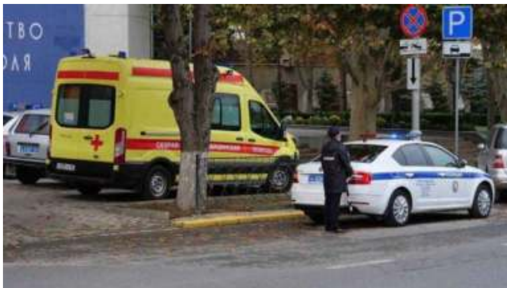
Территория, прилегающая к зданию Правительства Севастополя, перекрытая в связи с получением сообщения о минировании. 1 ноября 2021 года

1 ноября 2021 года неизвестные сообщили о взрывном устройстве, которое якобы находится в здании Правительства Севастополя. После чего из здания в течение 10 минут эвакуированы все сотрудники, периметр оцеплен силами правоохранительных органов. По результатам проведенной проверки информация не подтвердилась 2 .