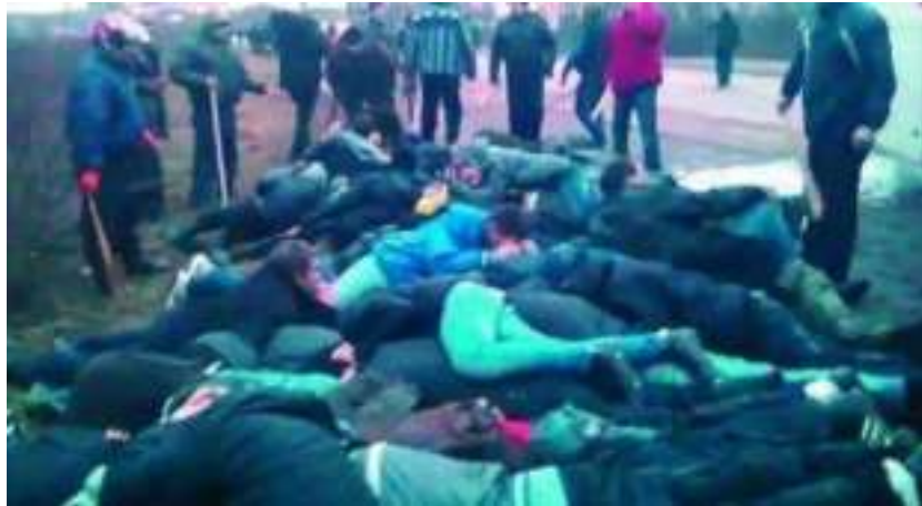
Корсуньская трагедия. Украинские национал-радикалы пытаются возвращавшихся в Крым активистов Антимайдана. Февраль 2014 года

После этого со многих крымчан сняли обувь «для нужд бойцов Майдана» и гоняли вокруг автобусов, заставляя собирать разбитые стекла. Унижения и издевательства продолжались в течение нескольких часов. Среди пострадавших имелись жертвы (несколько человек были искалечены, а несколько, по всей видимости, убиты) 1 . Большая часть автобусов была сожжена. Вызванная местная милиция предпочла не вмешиваться 2 .