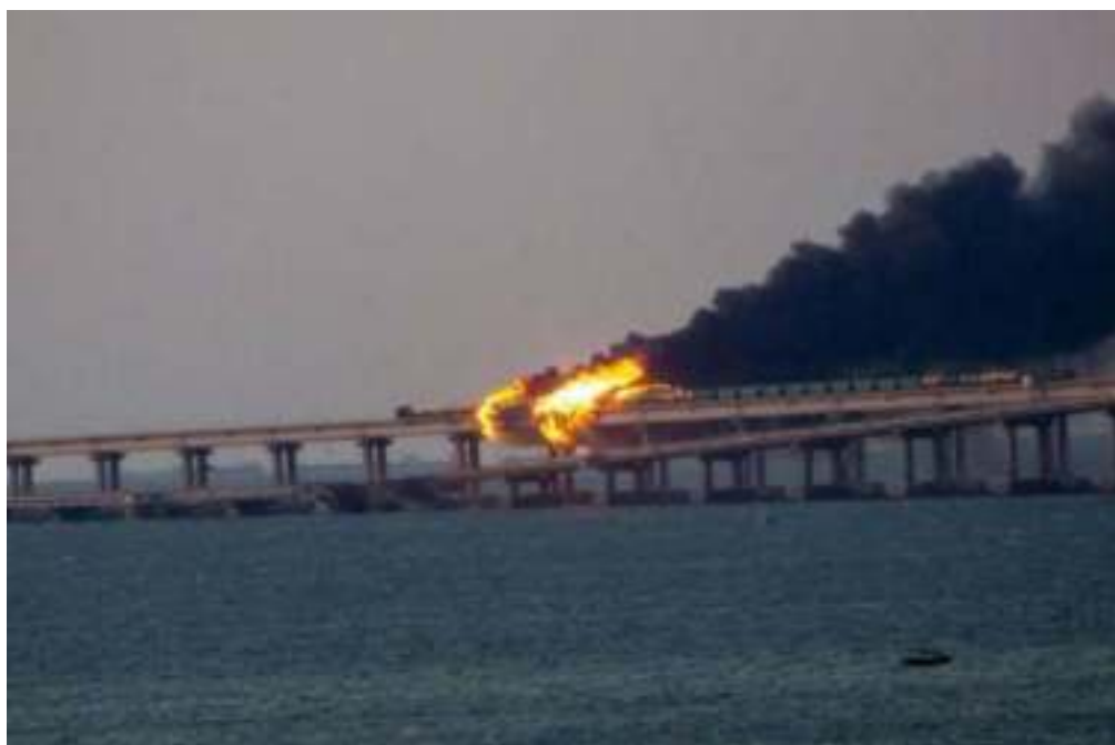
Последствия теракта на Крымском мосту: горящие цистерны железнодорожного состава и обрушенные пролеты моста. 8 октября 2022 года

8 октября 2022 года Украина организовала террористический акт на Крымском мосту. На автомобильной части Крымского моста со стороны Таманского полуострова между единственной аркой и островом Тузла в 6:03 по местному времени произошел подрыв. Взрывчатка находилась в грузовой фуре, которая выехала из Краснодарского края и направлялась в Керчь. В результате подрыва были обрушены три пролета шоссейной части моста, а на железнодорожном мосту загорелись семь топливных цистерн. Погибли водитель грузовика, перевозившего взрывчатку, а также водитель и пассажиры легковой машины, ехавшей рядом 2 .