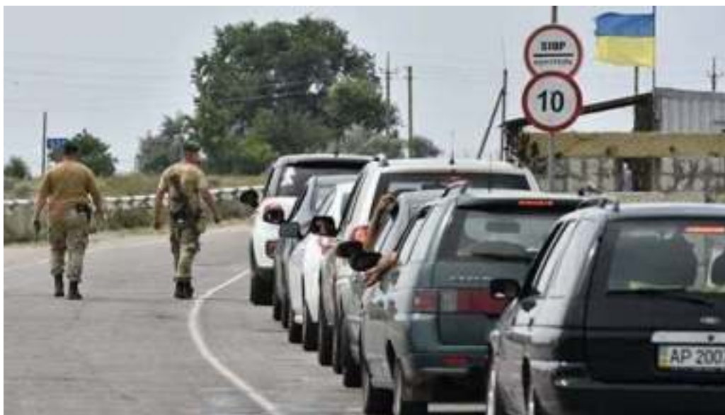
Автомобили на пункте пропуска с украинской стороны границы

Отметим, что проблема транспортной блокады Крыма была разрешена в ходе СВО, когда в результате успешных действий Российских Вооруженных Сил были разблокированы автомобильные и железные дороги, связывающие полуостров с Херсонской областью и другими освобожденными территориями.