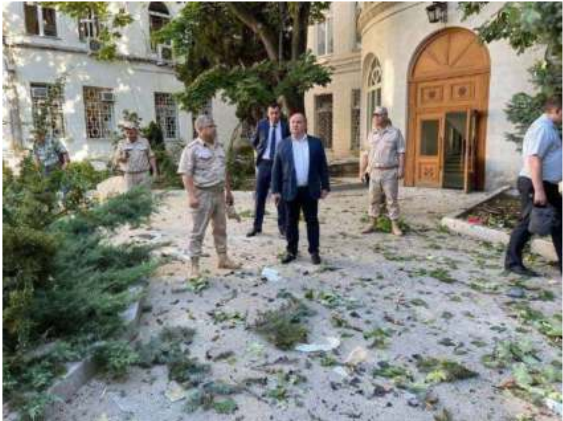
Губернатор города Севастополя М.В. Развожаев у входа в здание штаба ЧФ после атаки украинского БПЛА. 31 июля 2022 года

Произошедший инцидент потребовал принятия экстренных мер по усилению безопасности.