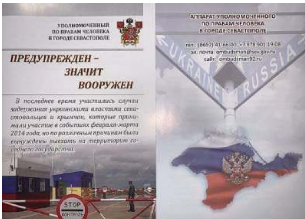
Лицевая и задняя сторона разворота памятки для военнослужащих