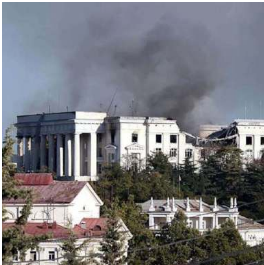
Историческое здание штаба ЧФ в городе Севастополе после ракетного удара со стороны Украины. 22 сентября 2023 года

22 сентября 2023 года по зданию был нанесен ракетный удар.