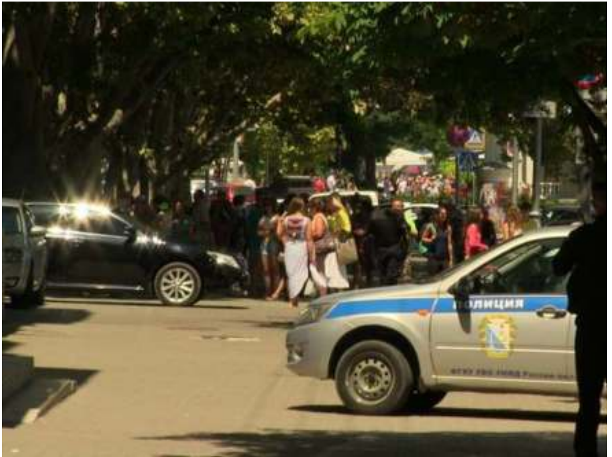
Центр города Севастополя, перекрытый в связи с сообщением о возможном минировании. 21 июля 2016 года

В результате депутатов и сотрудников городского парламента эвакуировали, пешеходное и транспортное движение на участке от Дома офицеров (улица Ленина) до площади Нахимова было перекрыто 1 .