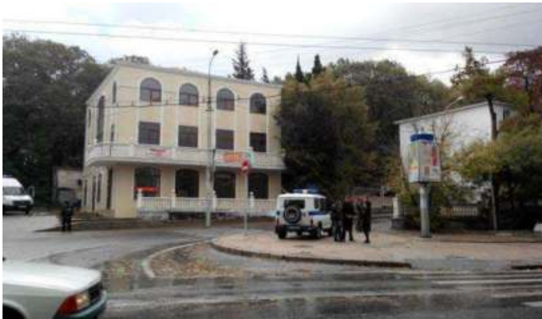
Дорога, ведущая на ул. 4-я Бастионная в городе Севастополе, перекрытая сотрудниками полиции в связи с сообщением о минировании одного из домов. 24 сентября 2014 года

23 сентября 2014 года в полицию поступил звонок о заминировании дома на улице 4-я Бастионная в городе Севастополе. С вечера 23 сентября улица была перекрыта. Поиск взрывного устройства продолжился и утром 24 сентября. Личный и общественный автотранспорт не пропускали на отрезке от бывшего казино «Луксор» до здания Севастопольской телерадиокомпании. Работающим в близлежащих офисах севастопольцам пришлось добираться до работы пешком 1 .